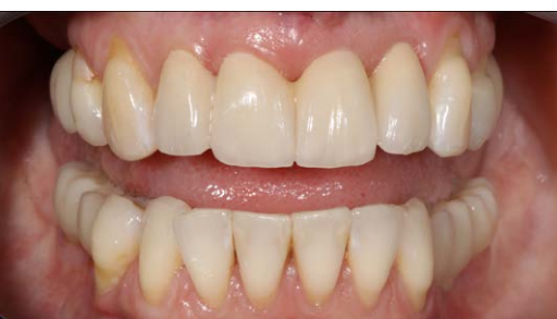
9. Finale Versorgung