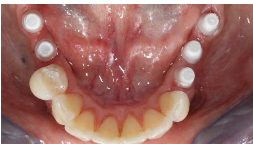
7. 4 Monate später