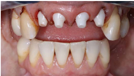
5. Direkt Postoperativ