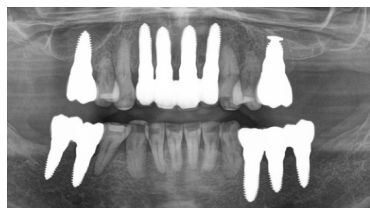
10. 3. Sitzung / 2. Aufenthalt