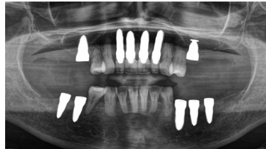
4. Chirurgie ALL IN ONE